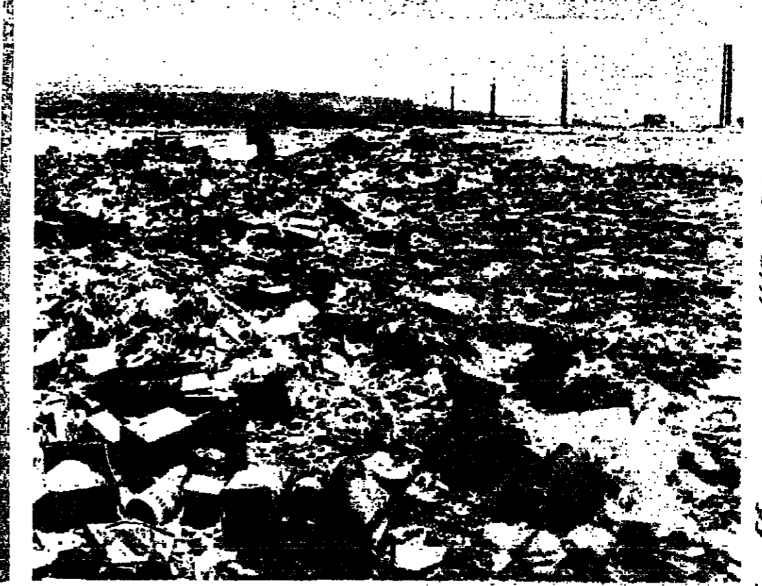
شواطئ بيروت المغطى ! التفتت بيروت الآن كشكلة نسي بيروت . فانتجها في تزايد وريتها في اتساع حتى اصيحت تغطي معظم شواطئ العاصمة . والبلدية لا تفك مكتومة الايدي . فجزائرها تعمل ولكنها تنقل التفتات من مكان لآخر ، ومع النقل تنقل المشكلة بقتنار ايجاد حل نهائي . فلما عمل تفتات واما « نيليط البحر »